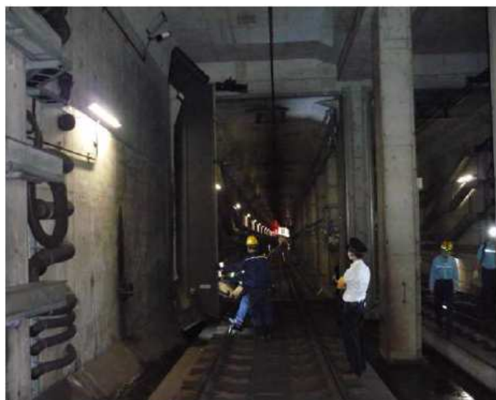
「阪神なんば線九条～桜川地区水防訓練」2021年5月15日（九条駅付近にて）

昨年度に続き2021年度は、梅雨入りを間近に控えた5月に第二種鉄道事業者である阪神電気鉄道株式会社実施する「阪神なんば線九条～桜川地区水防訓練」に参加し、各駅の水防鉄扉、止水パネルの閉鎖・開放作業・点検等を確認しました。本訓練への参加は、非常時に備えた取組みの一環として2012年度より継続しております。